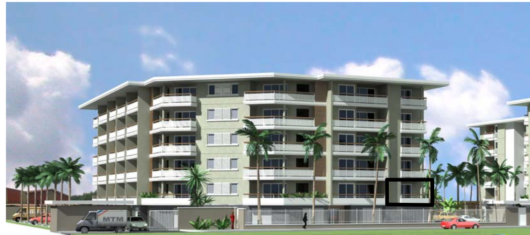
DOCUMENT NON CONTRACTUEL