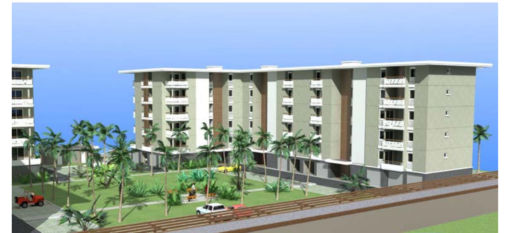
DOCUMENT NON CONTRACTUEL